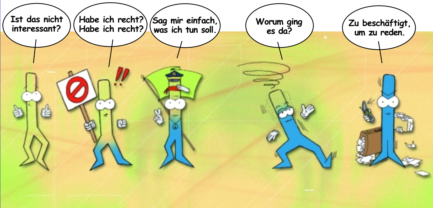
Abbildung 2: Aufmerksamkeitseinheiten

Das Gefühl von geistiger Erschöpfung, Reizbarkeit und Überwältigung taucht dann auf, wenn die Welt von dir mehr freie Aufmerksamkeit verlangt, als du zur Verfügung hast.