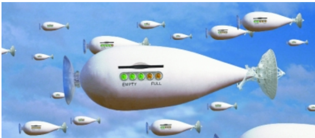
Abbildung 3: Freie-Aufmerksamkeitseinheiten-Luftschiff

Manche Dinge sind so mit Interesse und Bedeutung aufgeladen, dass sie jedes Luftschiff erfordern, das du nur entsenden kannst.